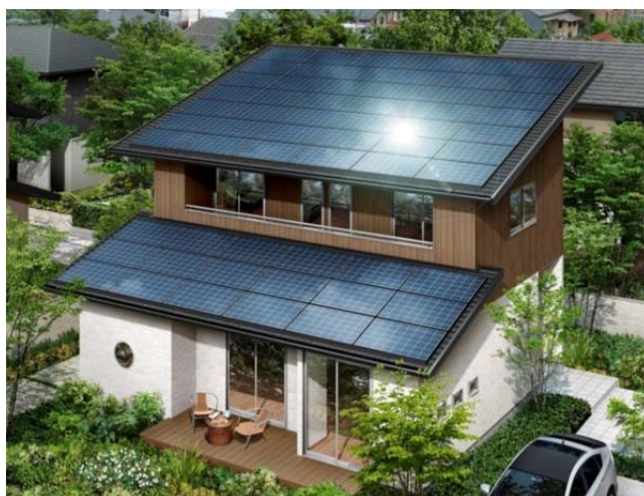
※太陽を活かす家外観イメージ 延床面積102.75㎡ 太陽光発電15.3kw搭載で20年間住宅ローン返済が実質0円に（プラン③）

当社では全国工務店ネットワークジャープネットへの将来の展開も視野に入れながら、現在50%となっている当社の太陽光発電搭載率を今期中に100%に近づけてまいります。