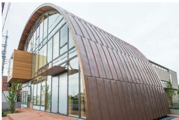
埼玉北支店 住まいと暮らしサロン