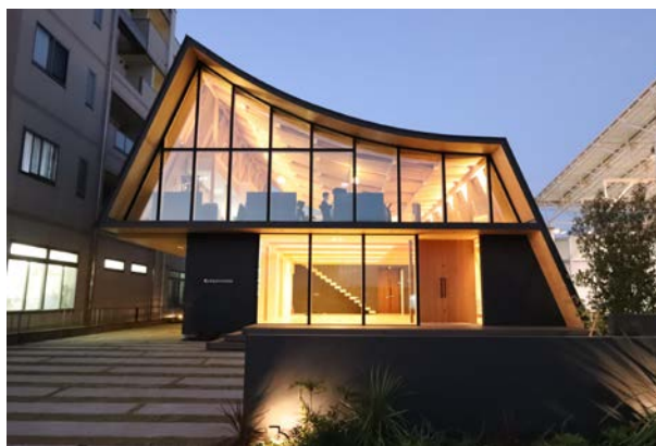
つくば支店 住まいと暮らしサロン