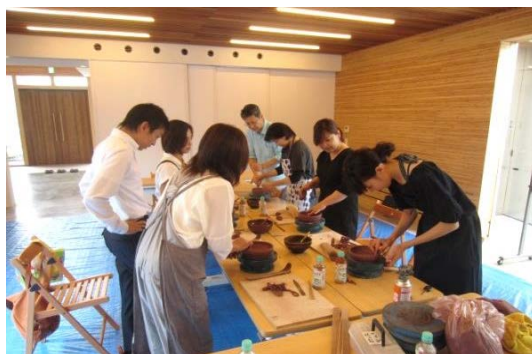
写真：住まいと暮らしサロン 豊かな暮らし講座の様子

「住環境を提供する企業の特徴を生かした就労環境を提供しており、同時に地域貢献の拠点としても機能していること」です。具体的には、①「住まいと暮らしサロン」として全国展開の拠点機能だけでなく、地域のイベント等が実施できる造りにしていること、②労働環境が向上する木造事務所を自社で設計・施工し、生産性に関して具体的な成果をだしていること、③ビジュアルはもちろんのこと、働きやすい職場設計となっていることです。