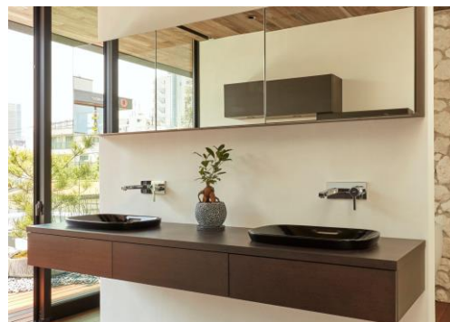
右写真: 洗面ボウル(漆塗)