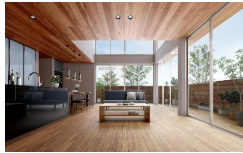
剛木造で実現する仕切りの無い大空間、大開口のイメージ