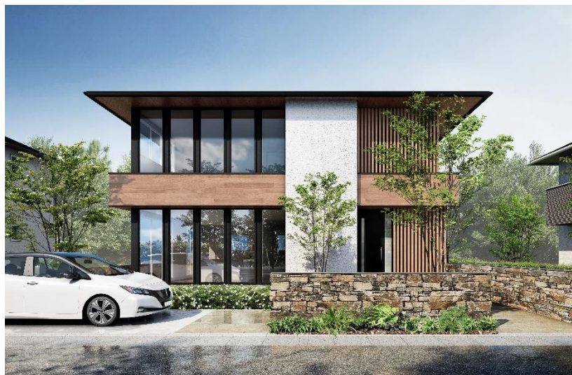
フェア特別限定仕様商品「剛木造 超空間の家 FREE 3 」外観イメージ

株式会社AQ Group（本社：東京都新宿区、代表取締役社長：宮沢 俊哉）、(旧アキュラホーム)は、4月29日～5月18日まで「45周年・過去最高売上達成記念フェア」を開催します。昨年12月に発売し、手ごろな価格で好評をいただいた「剛木造 超空間の家スマート」(現在、オリジナル構法・剛木造「超空間の家」として特許出願中)をベースにした特別限定仕様「剛木造 超空間の家 FREE 3 (トリプルフリー)」を限定20組に抽選販売します。昨今の住まいづくり3大不安を解消する特別仕様で豊かな暮らしを実現します。