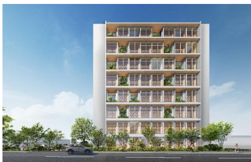
来年4月完工予定の新社屋となる 8階建て純木造ビル外観イメージ

また、将来のライフサイクルに応じて、大規模な改修をせずに間取りを変更出来る優れた可変性も有します。単世帯から2世帯へのリフォームの場合、“剛木造”は一般的な住宅と比べ費用も工期も1/3程度に抑え間取りの変更が実現します。将来のライフステージやコストまで考慮し、お客様の暮らしに永代寄り添い続けます。