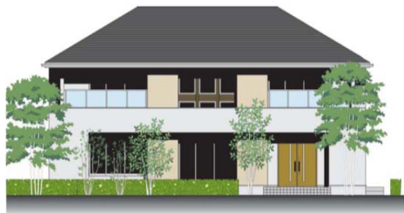
神戸展示場外観イメージCG(正面)

「OPTIS住み継ぐ家 神戸展示場」は、国の認定基準を上回る基本性能を持つ長期優良住宅を標準仕様とし、昔から日本人が四季を通じて培ってきた、自然とともに快適に暮らす知恵(日射遮蔽・日射熱利用・自然風利用)を採用しています。