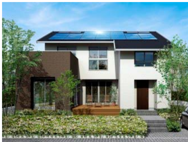
長期優良エコ住宅「Meguru-Plus」外観CG

日本最大のホームビルダーネットワーク「ジャーブネット」(主宰:株式会社アキュラホーム、代表取締役社長宮沢俊哉、東京都新宿区)は、次世代省エネ基準のエコ住宅に太陽光発電システム、給湯システム(太陽熱温水器&エコキュート)などの創エネルギーを搭載した 1000万円台からのスマートハウス「長期優良エコ住宅 Meguru-Plus(めぐるプラス)」を1月2日より全国の工務店で一斉発売いたします。同商品は、年間光熱費収入(※1)を5万円稼ぐ(※2)ことが可能となります。また、業界では初となる「光熱費収入補償」をお付けし、光熱費収入プラス5万円を補償いたします。 ※1 年間光熱費収入は年間売電分が年間買電とガス代の合計を上回ること ※2 当社試算