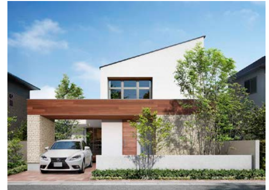
「太陽を活かす家 ZEH」外観イメージ 太陽光発電10kW搭載、延床面積117.58㎡、本体価格2,040万円(税込)～ ※イメージ写真と異なる場合があります。

キャンペーンの対象となる「太陽を活かす家 ZEH」は、屋根一体型の太陽光発電10kWを標準搭載する他、オール電化、樹脂複合サッシ(アルゴンガス入り)、スマートHEMS(家庭用エネルギー管理システム)、高効率エアコン、全室LED照明などによる、ゼロエネルギーハウス(ZEH)で、一次エネルギー消費量を35%(※1)削減を目指します。アキュラホームは環境貢献企業として環境に配慮するとともに、住む人の経済的負担軽減に寄与する住宅を提供していきます。