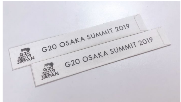
大阪サミット限定のストロー