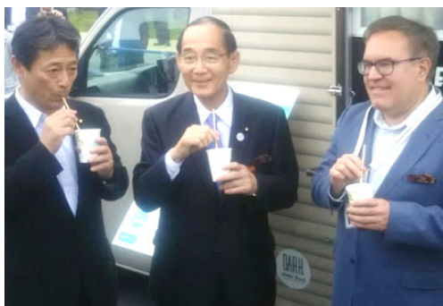
G20 環境相大臣会合での様子

大阪サミットをはじめ、2019 年に開催された全ての G20 会合で、木のストローが採用されました。G20 大阪サミット／G20 新潟農林水産大臣会合／G20 茨城つくば貿易・デジタル経済大臣会合／G20 福岡財務大臣・中央銀行総裁会議／G20 持続可能な成長のためのエネルギー転換と地球環境に関する関係閣僚会合／G20 愛媛・松山労働雇用大臣会合／G20 岡山保健大臣会合／G20 北海道倶知安観光大臣会合／G20 愛知・名古屋外務大臣会合 累計 6,170 本を提供。 その他、G20 消費者政策国際会合、G20 文部科学省主催教育関連イベントでも提供されました。