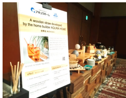
G20 夕食会場での様子