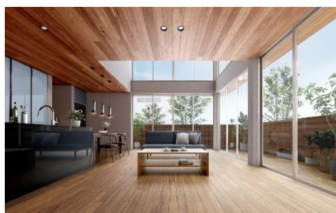
剛木造で実現する仕切りの無い大空間、大開口のイメージ