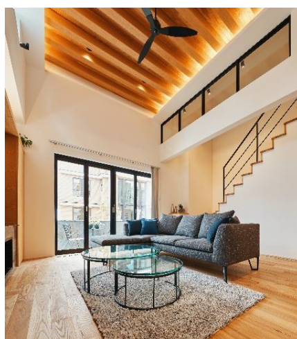
期間限定商品「剛木造 超空間の家 FREE 3 +」外観・内観イメージ