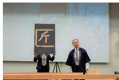
社長と新入社員、大工で作る「匠」文字