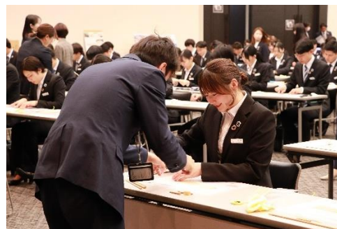
先輩社員が作り方を教えている様子