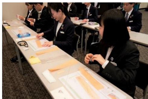
同期と楽しみながら行う木のストロー製作体験

AQ グループは「木のストロー」の他にも、小学校に天板を寄贈する「木望の未来プロジェクト」などの SDGs 活動を実施しています。100 年先、200 年先も永代愛される「家」「街」「地球」を残し、お客様の豊かな暮らしの実現を目指し、商品・サービスを提供してまいります。