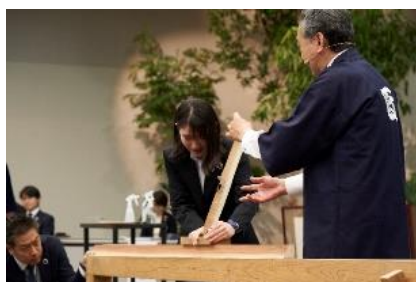
新入社員のカンナ削り体験