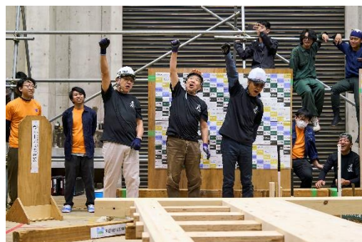
60 歳以上のメンバーが解体を行う「AQ チーム匠」