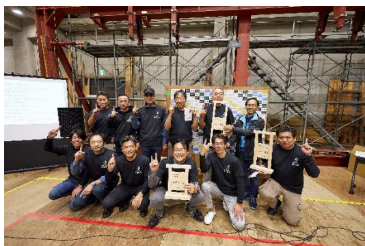
3 冠を達成した「AQ チーム匠」