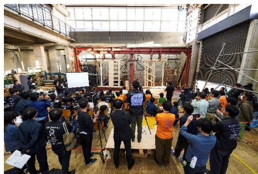
トーナメント決勝の様子

AQ Group は、稲山正弘教授（東京大学）・篠原商店とのプロチーム「AQ チーム匠」としてエントリー。学生や他企業と競い合いながら20 年以上スポンサーとしても参加しています。今年は2 年前に滋賀職業能力開発短期大学校に敗北した耐力壁「ヴィーナスの誕生」を改良進化させた「ヴィーナスの逆襲」で参戦。ラーメン柱と6 本の横貫材で構成され、ラーメン柱と貫の接合部のめり込みにより、高耐力と高靱性を兼ね備えた耐力壁です。1 回戦（VS 東京大学木質材料学研究室）、2 回戦（VS（仮称）東大社会人学生チーム）、決勝戦（VS TEAM HOSEI）の激戦を勝ち抜き、トーナメント優勝・総合優勝のW 優勝を達成しました。また、26 年続く大会史上最高の最大耐力“71.2KN”を達成し大会新記録を更新し、耐震部門賞を受賞しました。