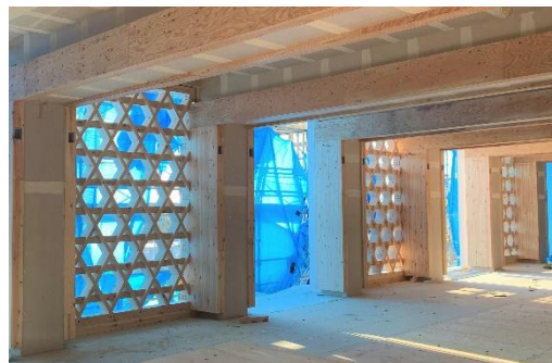
8 階建て純木造ビルに採用した「組子格子耐力壁」