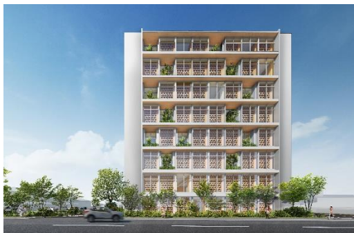
新社屋となる日本初の「8 階建て純木造ビル」

AQ Group は技術開発において 5 度の実物大耐震実験や耐風実験などの実証実験によって得られるデータを重要視しています。20 年以上参加し続けている「カベワン GP」も耐力や破壊性状などの貴重な実践データを得ることができる場として研究開発に活用。現在、建築している日本初の「8 階建て純木造ビル」（埼玉県さいたま市・2024 年 4 月完成予定）や、「5 階建て純木造ビル」（神奈川県川崎市）などの中大規模木造を実現する「組子格子耐力壁」、「相欠き合わせ柱式ラーメン」といった技術は、この「カベワン GP」から誕生しました。また、注文住宅ブランド「AQURA HOME」では、オリジナル構法である「未来構法 剛木造」として中規模木造建築の技術を応用。従来は鉄骨造、RC（鉄筋コンクリート）造でしか実現できなかった空間を木造で実現する技術の礎となっています。