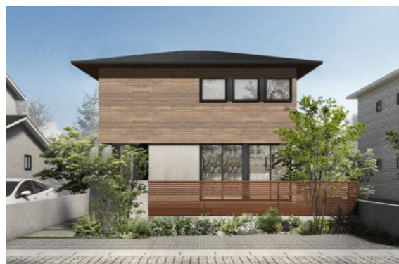
剛木造「超空間の家 スマート」外観イメージ

アキュラホームグループは、中規模木造建築や世界初となる「5 階建て純木造ビル実大耐震実験」など 5 回にわたる実物大耐震実験などの研究成果や営業体制、設計体制、建材の商流などの合理化により、27.6 坪 2 階建てで税抜 1,460 万円(税込 1,606 万円)から販売します。あわせて、「総額 5 億円分光熱費応援キャンペーン」を開催。賢く暮らす住まいづくりを提供することによって、住まいにかかるインシヤルコストやランニングコストを軽減し、物価高騰や光熱費負担増に伴う生活費負担の上昇によって圧迫されている家計を応援します。