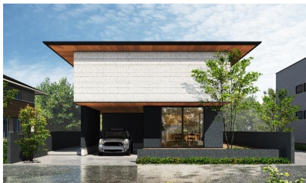
「剛木造 超断熱の家 プレミアム」外観イメージ