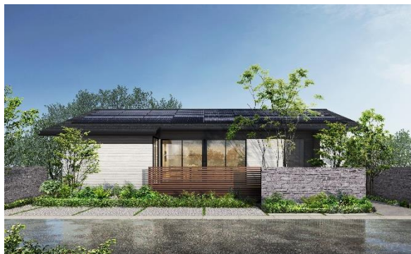
「剛木造 超空間の平屋」外観イメージ

AQ Groupは「5階建て純木造ビル モデルハウス」や邸宅建築、分譲住宅やリフォームなど事業領域を拡大しており、昨年度、3年連続2桁増の売上高を達成しました。今年10月に45周年を迎えるにあたり、多くのステークホルダーの皆さまへ還元するべく「45周年・夏の大感謝祭フェア」を開催いたします。フェアでは「最大1,000万円相当分が当たる！大抽選会」を実施。抽選で当選されたお客様には最大1,000万円相当分の効果が見込める設備等の選べる特典をプレゼントします。申し込み期間は7月22日～8月17日。WEBサイトや全国のアキュラホームとFC加盟店のモデルハウスやまちかどアキュラホームで受付を実施いたします。また、同期間限定で、「AQ地震建替保証」付きの新商品「剛木造 超断熱の家 プレミアム」と「剛木造 超空間の平屋」を200棟で先行販売します。