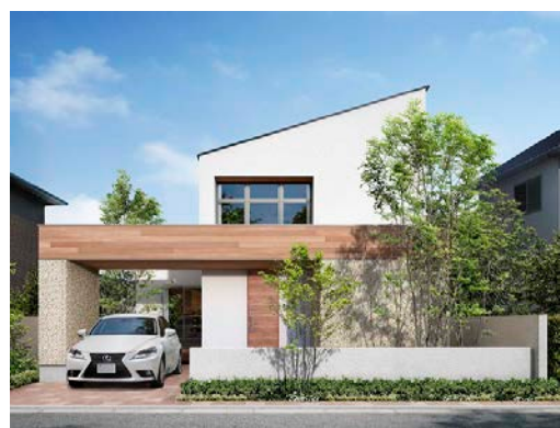
「太陽が稼ぐ家 ZEH」外観イメージ 太陽光発電 10kW 搭載、延床面積 117.58 m 2 本体価格 2,040 万円（税込）～ ※イメージ写真と異なる場合があります。

●写真データは右記よりダウンロードすることができます。 http://www.aqura.co.jp/news.html