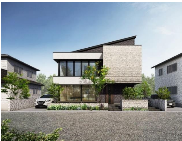
超空間の家 Neo 外観イメージ

従来の日本の住宅は、断熱性の低さから部屋を細かく仕切り、各室ごとに冷暖房を行っておりました。吹き抜けのような大空間や大開口を設けると冷暖房は効きにくくなり、光熱費の負担が大きくなるため、その負担に耐えられる家計でなければ実現が困難なものでした。「超空間の家 Neo」では従来の木造住宅を進化させ、2階建て 96.88 m 2 (約 29.30 坪)で 1,680 万円(税抜)～から邸宅のような空間を実現することが可能です。また、高断熱、太陽光発電などの「次世代エコシステム」の採用によって一般の住宅と比較し生涯コストである光熱費を35年間で800万円以上抑えることが可能となります。