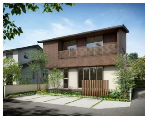
写真＝「太陽を活かす家-初夏-」外観イメージ 太陽光発電 10.4kw 搭載 延床面積 97.70㎡ 本体価格 1,750万円（税込）※プラン2の場合

「太陽を活かす家-初夏-」では「屋根貸し共同事業プラン」と「自己買取プラン」の2つのプランで発売します。また、「太陽を活かす家-初夏-」は固定価格買取制度での売電価格より20年間+1円/kw高く売電することを可能にしました。売電価格が2015年4月1日から29円（税別）に下がり、7月からはさらに27円（税別）に下がることが決定しておりますが、当社は昨年7月に「環境貢献企業宣言」を掲げ、「太陽を活かす家-初夏-」を発売し、お客様の経済的負担を軽減する住宅を提供しています。