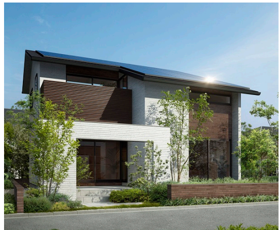
写真＝「太陽を活かす家W」外観イメージ 太陽光発電 10.4kw 搭載 延床面積 97.70㎡ 本体価格 1,790万円（税込）から

その背景として当社が主宰する住生活研究所の調査では、今後、未婚者、長寿命化による単身者の増加によって、住まい方が多様化すると予測しています。また、2015年1月の税制改正による相続税対策として、都市部を中心に賃貸併用住宅などの需要も高まっており、これらに対応できる住まいの可変性が求められています。