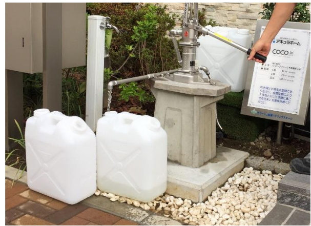
トイレなど生活用水として使用する井戸水を供給