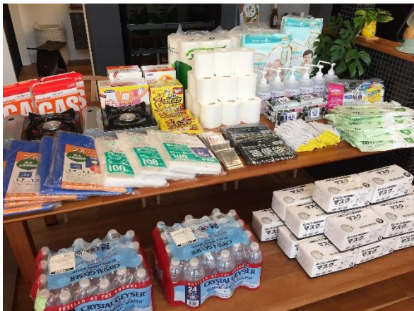
飲料水、カセットコンロのほかブルーシートやカイロなどを備蓄

当社の活動は地域に貢献できる拠点として注目を集めてまいりました。コロナ禍以降はウイルス対策仕様としてオゾン発生器や滅菌ライトの設置など、ソーシャルディスタンスも踏まえ安全・安心への配慮をさらに進めた災害時支援施設としています。