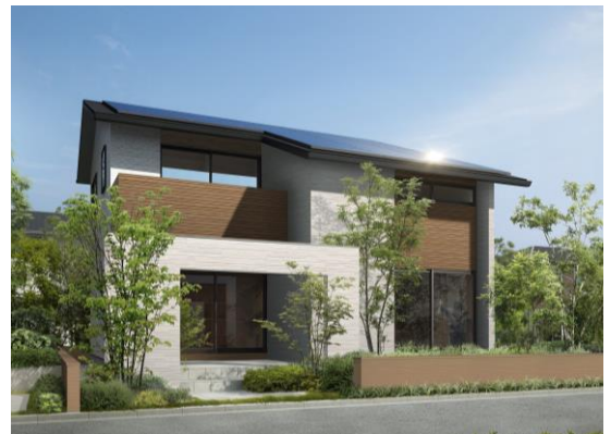
2階建て 3LDK 延床面積 104.75㎡ 建物本体価格 1,585万円(税抜)～ ※外観パースはイメージとなります。

アクюраホームグループは2020年7月に「新生活様式の家」を発表し、ウイルス対策に適応した住宅を提案してきました。しかしながら、未だ新型コロナウイルスのさらなる感染拡大や、新興種の出現など、ウィズコロナ時代は長期化することが懸念されています。感染者数の増加に伴い、ウイルス対策の方法も困難になりつつある中、注目を集めた住宅のウイルス対策を標準装備し、今後のウィズコロナの暮らしにも対応できる住宅商品「新しい生活様式の家「地球と家計にやさしい家」」を開発、発表いたしました。