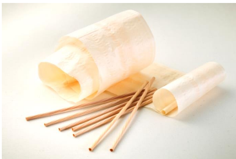
木製ストローAQURASとその材料(木を薄くスライスしたもの)

木造注文住宅を手がける株式会社アキュラホーム(本社:東京都新宿区、代表取締役社長:宮沢俊哉)は、5月11日(土)、12日(日)に日本で初めて開催されたG20の新潟農業大臣会合(新潟・朱鷺メッセ)で、世界初・木製ストローAQURAS(アキュラス)を提供いたしました。