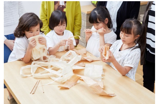
子供たちがカンナ削りの“木のストロー”を五感で楽しむ様子

キッズデザイン賞は特定非営利活動法人(NPO)のキッズデザイン協議会が主催するもので、「子どもや子どもの産み育てに配慮したすべての製品・サービス・活動・研究を対象とする顕彰制度」とされています。今回は437点の応募があり、そのなかから264点が受賞作品に決定。最終審査は9月に行われ、このなかから、内閣総理大臣賞としての「最優秀賞」、経済産業大臣賞、少子化対策担当大臣賞、消費者担当大臣賞、男女共同参画担当大臣賞としての「優秀賞」、キッズデザイン協議会会長賞としての「奨励賞」、東京都知事賞、審査委員会特別賞、TEPIA特別賞としての「特別賞」が決定される予定です。