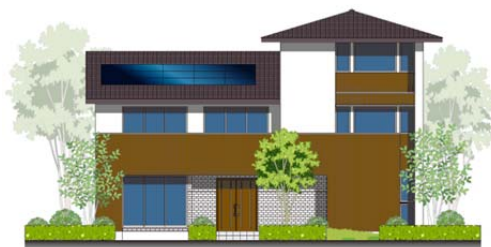
※戸塚展示場外観イメージ

水平ラインを活かしたモダンなデザイン、 木の質感を大事にした暖かみのある外観。 子どもと生活を楽しめる空間、高齢の方にも配慮した設計など 家族みんなが笑顔になれる住まいが実現しました。