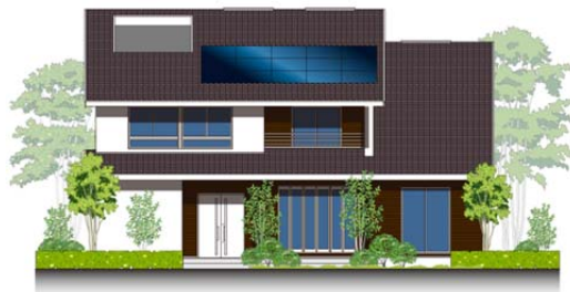
※小田原展示場外観イメージ

天窓から差し込む光、リビングを吹き抜ける風。 湘南の自然を取り込んだ住まいが実現しました。 家族の空間をゆったりと設け、 二世帯が快適に暮らせる工夫も備えています。