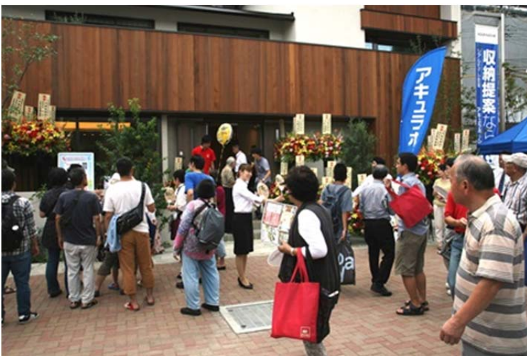
写真=戸塚展示場オープン日の様子。家族連れのお客様で賑わう展示場前。 14日（土）からの3連休で約200組が来場。

また、ご入居者様へは継続的な永代家守り活動（アフターサービス）を行ってまいります。