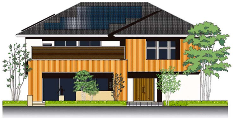
※習志野展示場外観イメージ

家中にあふれる「木」のやわらかさや温もり。自然エネルギーを巧に利用した、環境的・経済的に優しい家を実現しました。子育てがもっと楽しくなる体感提案型モデルハウスです。