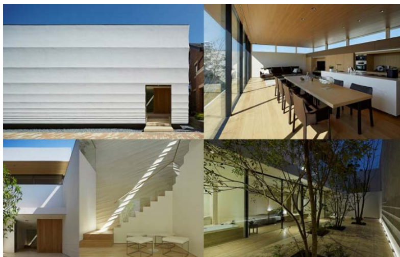
<AQ レジデンス 瀬田モデル>

「AQ レジデンス 瀬田モデル」は「都市に暮らす夫婦が住みごたえを追及し住みこなしていく住まい」を提案しております。伝統的な技術や材料・職人の手技にこだわり左官職人が外壁や内壁を現代デザインに仕上げ、庭師は季節の移ろいを一幅の絵として室内に誘導しています。これら日本独自の機能・自然・伝統美を兼ね備えた技術が建物に品格を与え、住まいへの愛着・永住意欲を掻き立てます。また、住まいづくりやメンテナンスに関わりを持つことで住まいへの関心度が高くなり、住みごたえを感じ、経験を振り返って住みこなしを実感していける住まいとなっています。