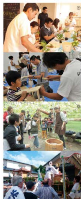
<ジャープネットの仕組み>